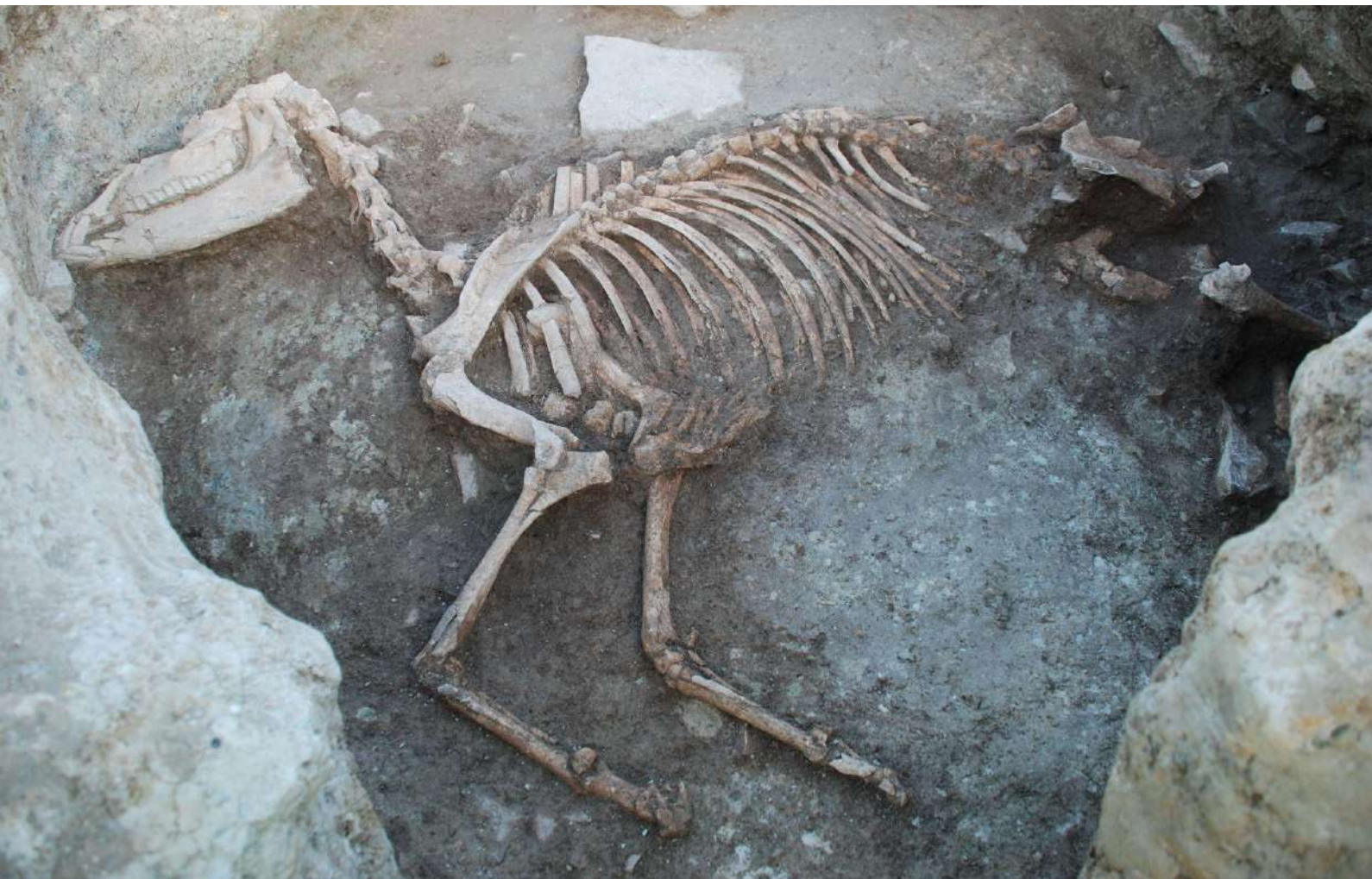
Esquelet de mula d'època ibèrica (s.II-I a.C) procedent del jaciment arqueològic de la Rosella (Tàrrrega).