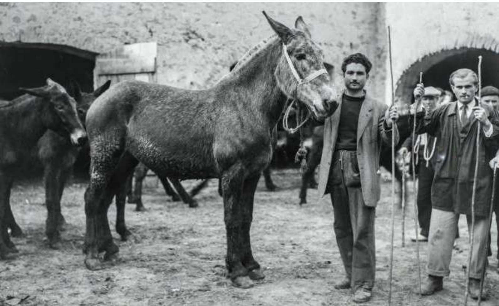
Tractants en una era de Salàs. Circa 1945.

Els cavalls que voldràs tenir per a llavor, cal triar-los de cos ample, formosos, sense part del cos no congruent amb les altres (...) És de gran interès de quin llinatge siguin, car hi ha moltes castes. Aposta per això, els cavalls de fama prenen nom de les regions d'origen (...)