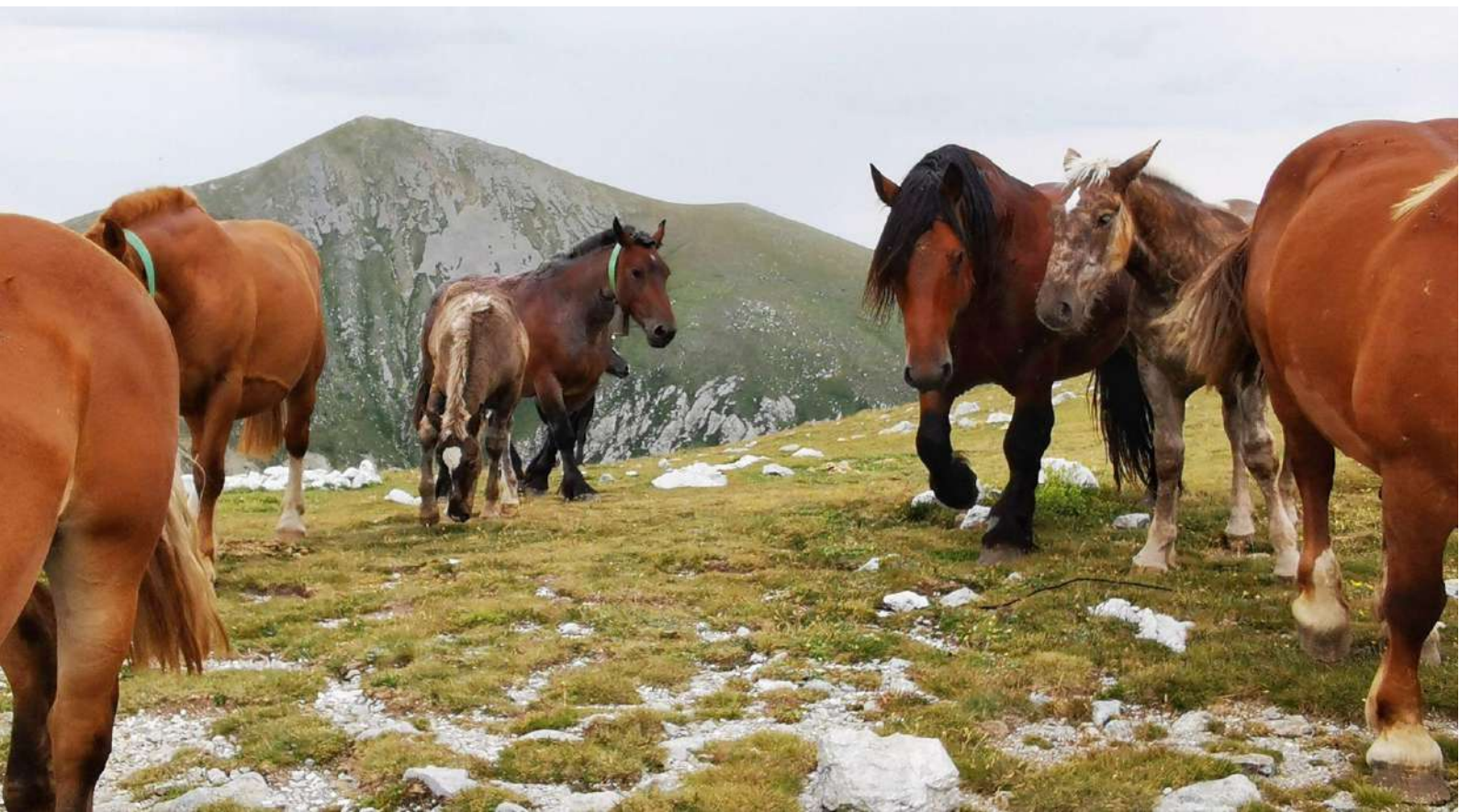
Ramat de cavalls pirinencs catalans.

Les races autòctones d'èquids actuals són el resultat de segles de coexistència i selecció genètica, que han donat lloc a espècimens més eficients i millor adaptats als nostres paisatges mediterranis. Aquest és un patrimoni biològic de valor incalculable que no podem deixar-nos perdre.