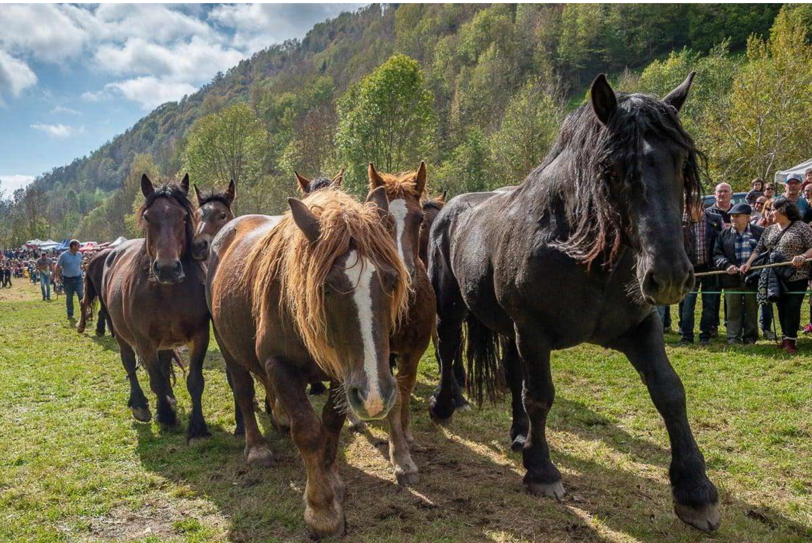
Ramat de cavalls pirinencs catalans.